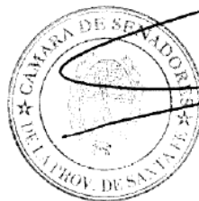
FELIPE MICHLIG Presidente Provisional CÁMARA DE SENADORES