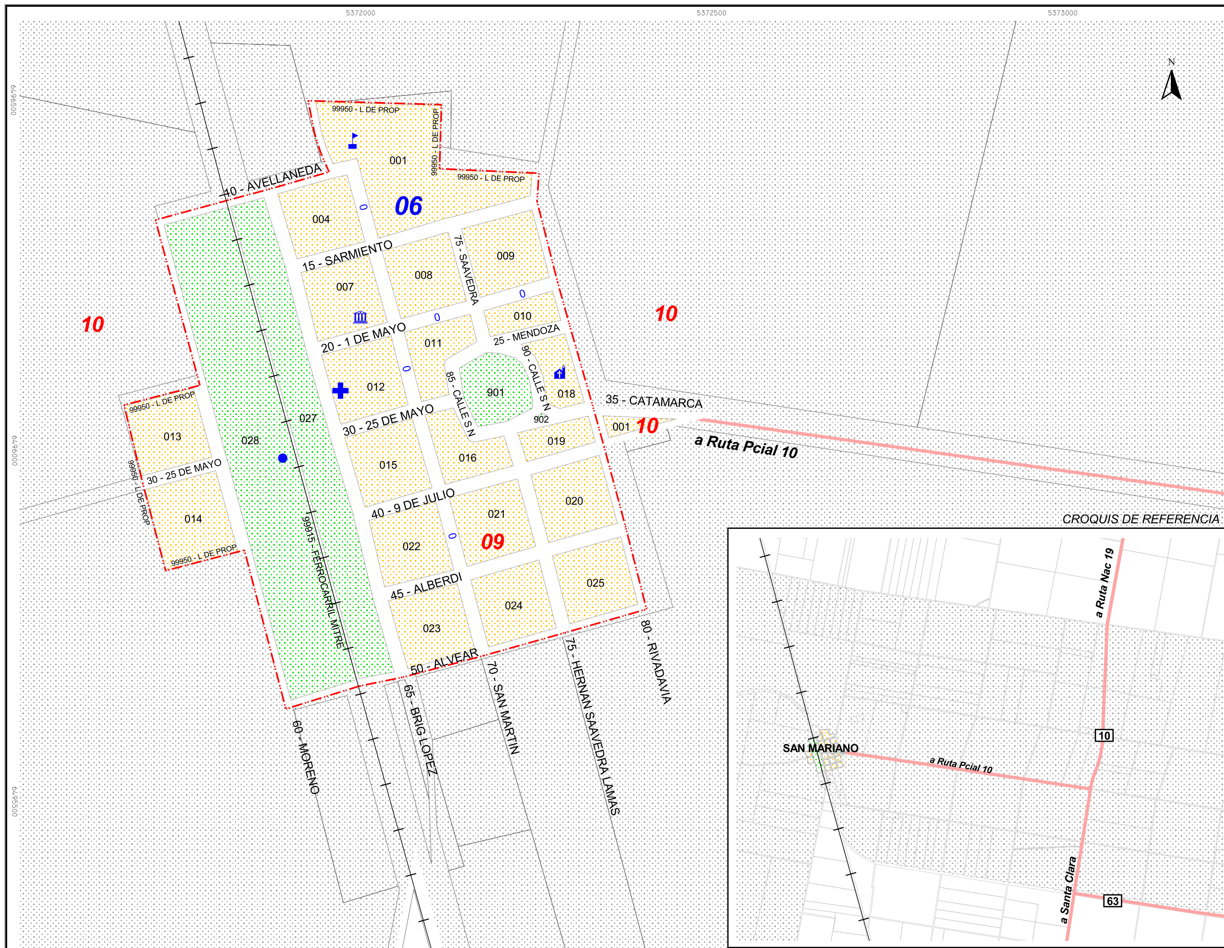
CROQUIS DE REFERENCIA