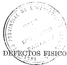
CUADRO 9. — POBLACION QUE ADOLECE DE CIERTAS INCAPACIDADES O DEFECTOS FISICOS, CLASIFICADA POR SEXO Y DEPARTAMENTO