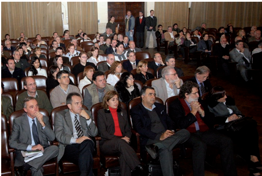
Imágenes del público asistente al Paraninfo de la Universidad Nacional del Litoral