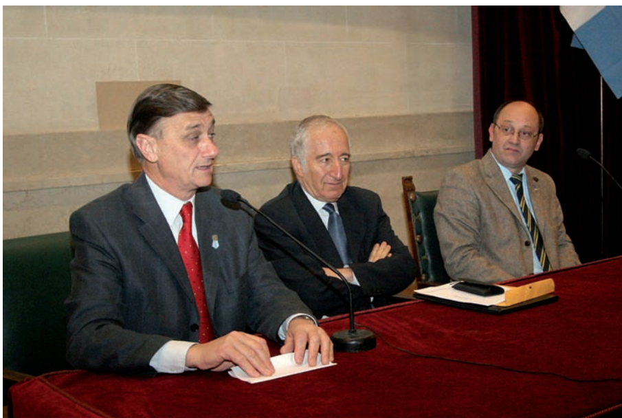
Hermes Binner , Gobernador de Santa Fe, inaugura la conferencia magistral